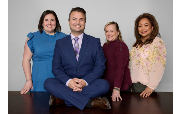
L'équipe de direction (de gauche à droite)

Nous vous invitons à visiter le www.hgmh.on.ca/fr/a-propos-de-nous/rapports-et-publications pour consulter l'ensemble du plan et soutenir la transformation de notre hôpital à long terme.